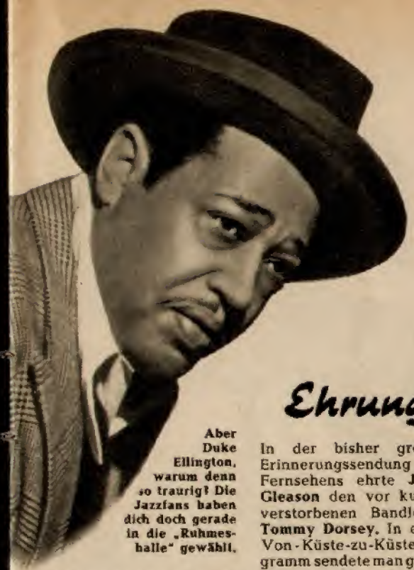
Aber Duke Ellington, warum denn so traurig? Die Jazzfans haben dich doch gerade in die „Ruhmeshalle“ gewählt.

vorragender Schnappschuß unseres Jazzfotografen Robert B. Lebeck. Unbeobachtet nahm er den Pianisten Oscar Peterson während seines Spiels auf. Und von Peterson, diesem hervorragenden Musiker, der ein Beethovenkonzert mit der gleichen Virtuosität spielt wie Jazz, entstand ein Bild, das alle die nachdenklich machen sollte, die glauben, daß Jazz Radau sei. Ganz gleich, was dieser Neger spielt, er lebt immer in seiner Musik. D. D.